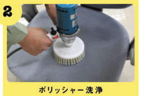
ポリッシャー洗浄