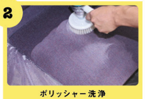
ポリッシャー洗浄